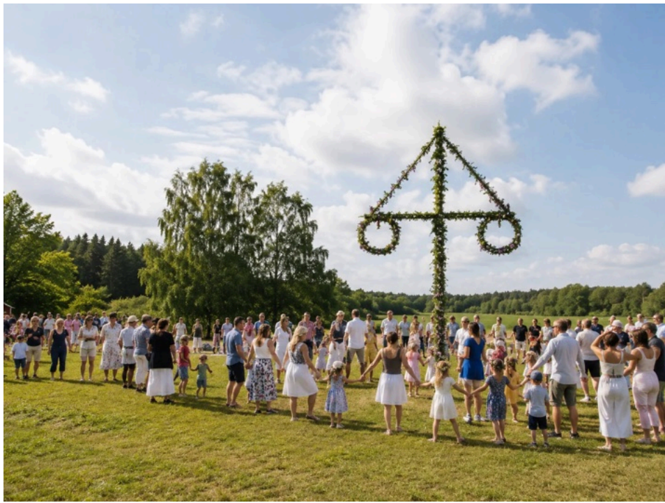
スウェーデンの伝統行事ミッドサマー