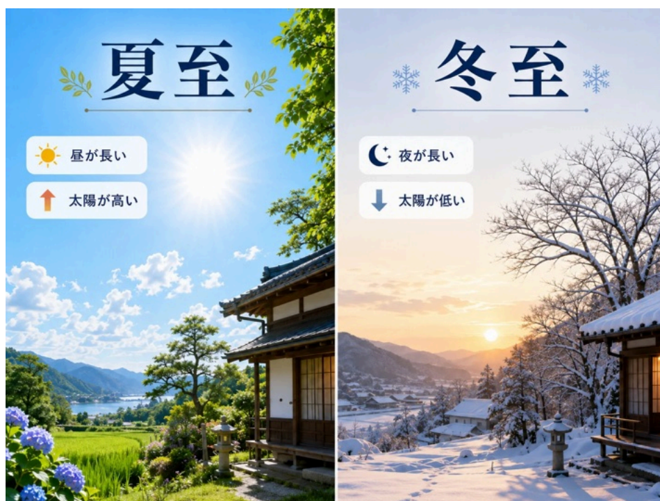
夏至と冬至の比較