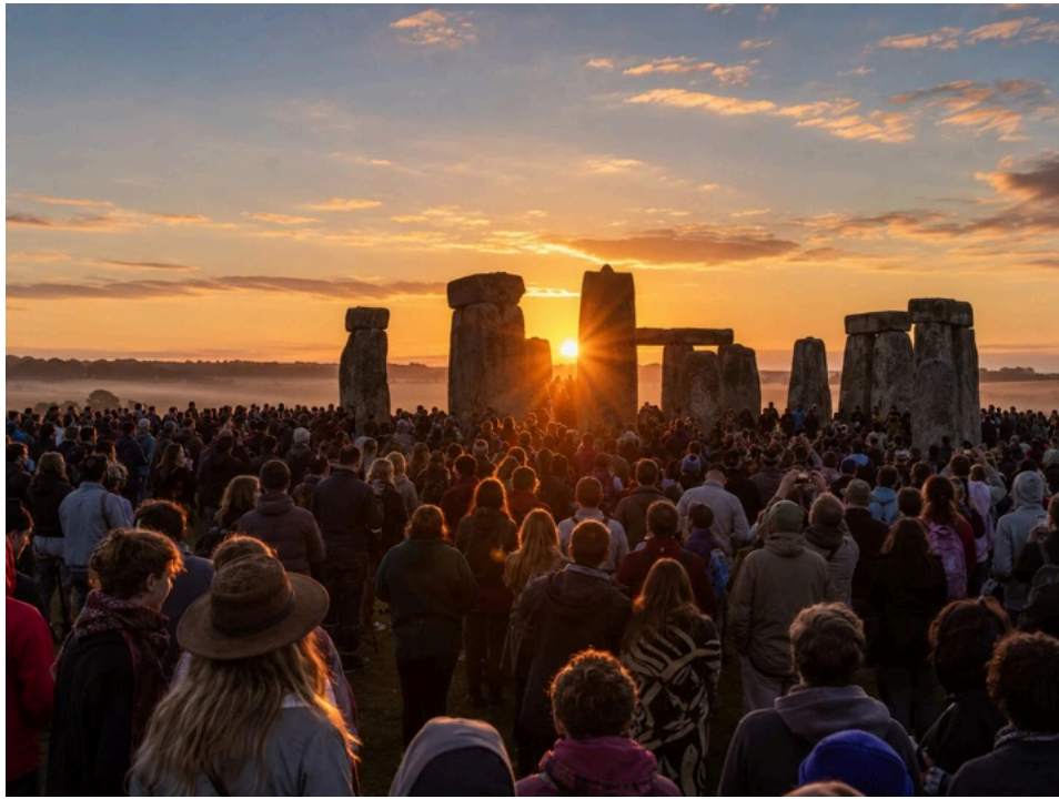
イギリスのストーンヘンジで夏至の日の出を待つ人々