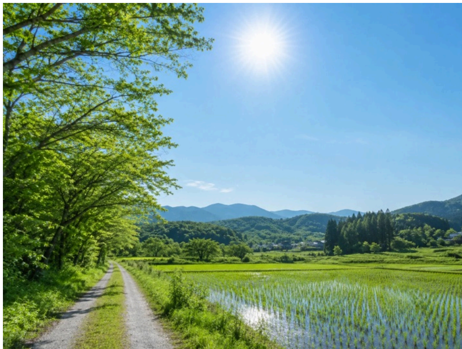
夏至は最も昼の時間が長い日