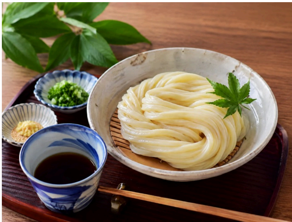
香川で食べられるうどん