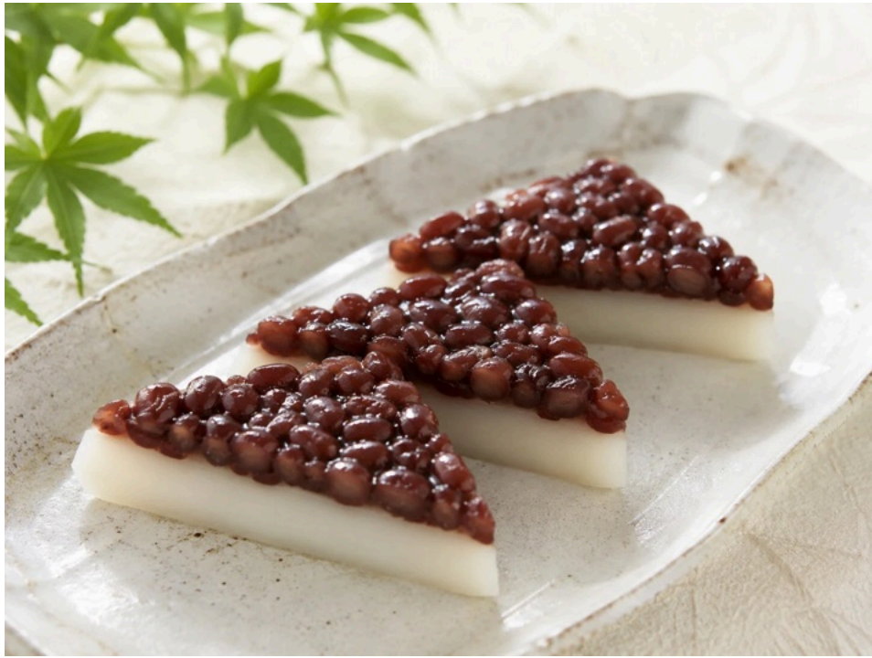
京都で食べられる水無月