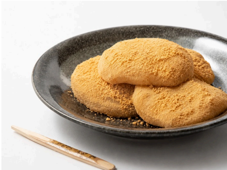
奈良で食べられる半夏生餅