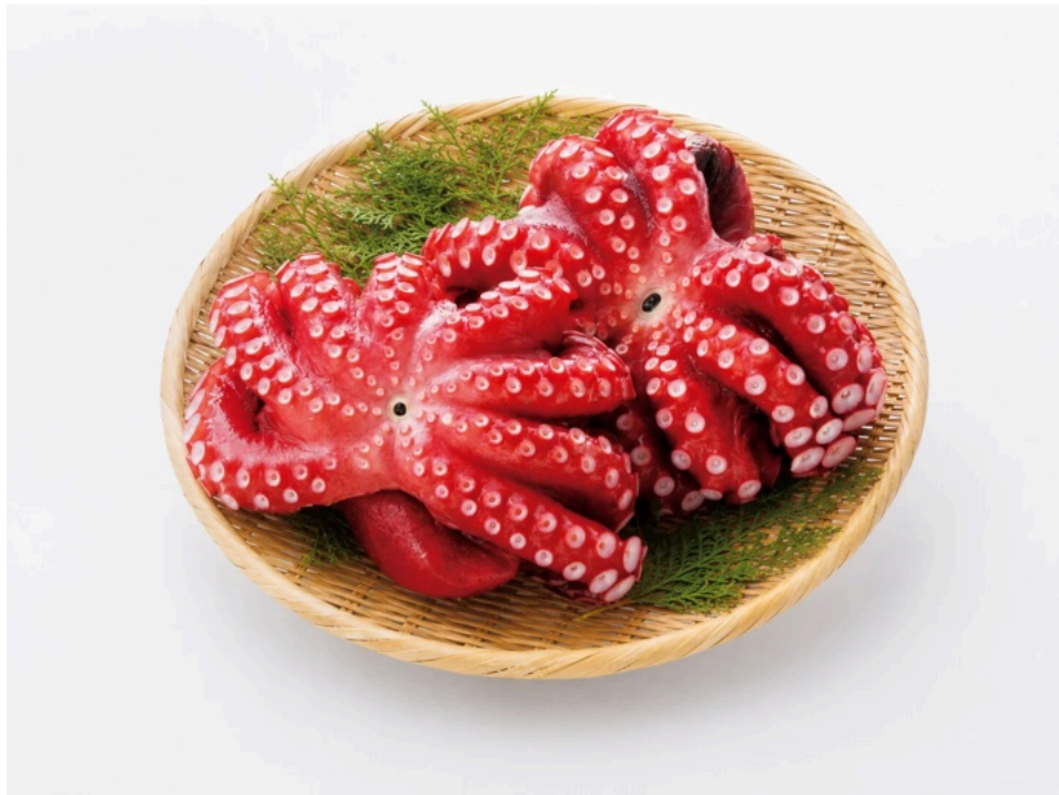
半夏生に関西で食べられるタコ