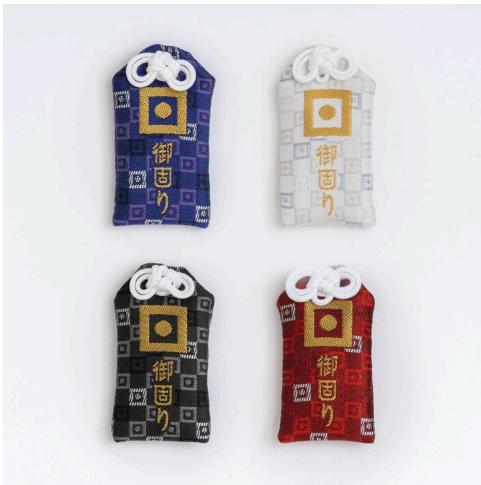
一般的な「袋型」のお守り