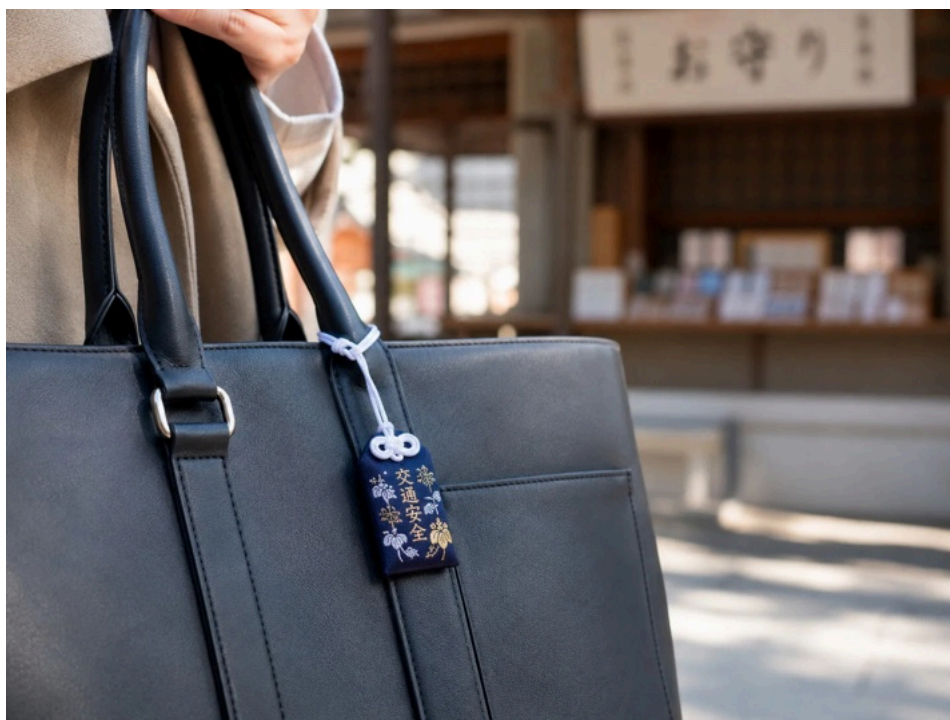
鞆に結びつけられたお守り