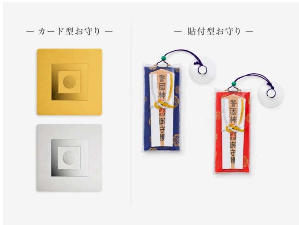
用途に合わせた様々な形状のお守り