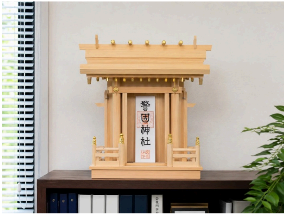
自宅や事務所にお祀りします